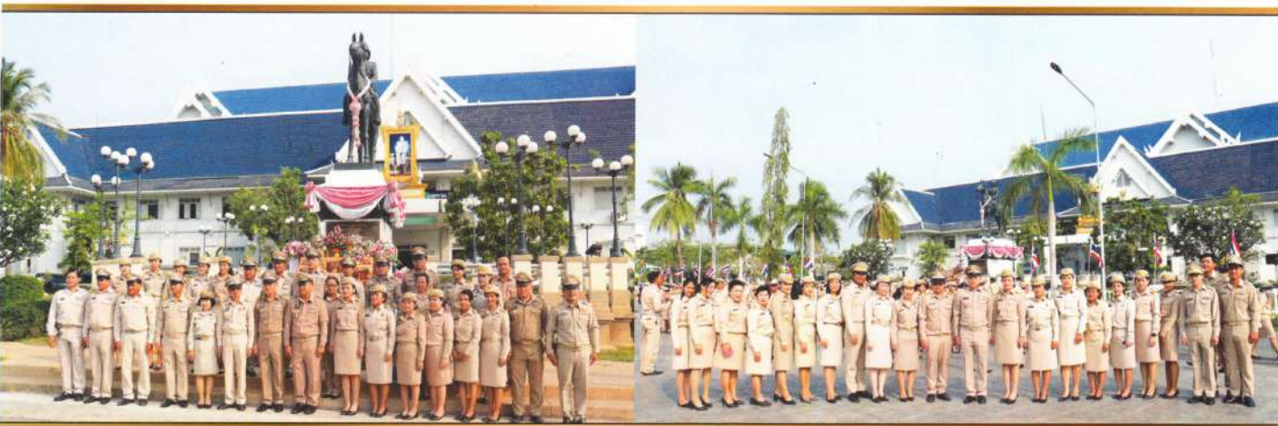
พิธีถวายราชสักการะพระบาทสมเด็จพระจุลจอมเกล้าเจ้าอยู่หัวเนื่องในวันท้องถิ่นไทย