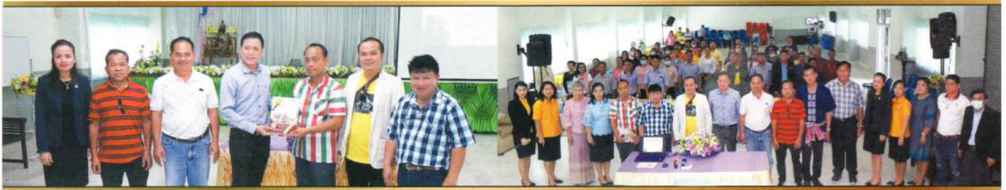
อบต.สร้างถ่อน้อย จ.อำนาจเจริญ