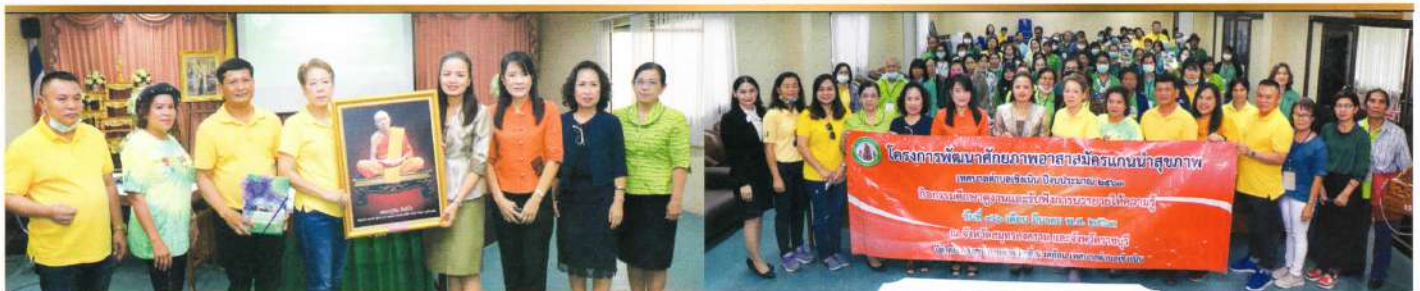
ทต.เชิงเนิน จ.ระยอง