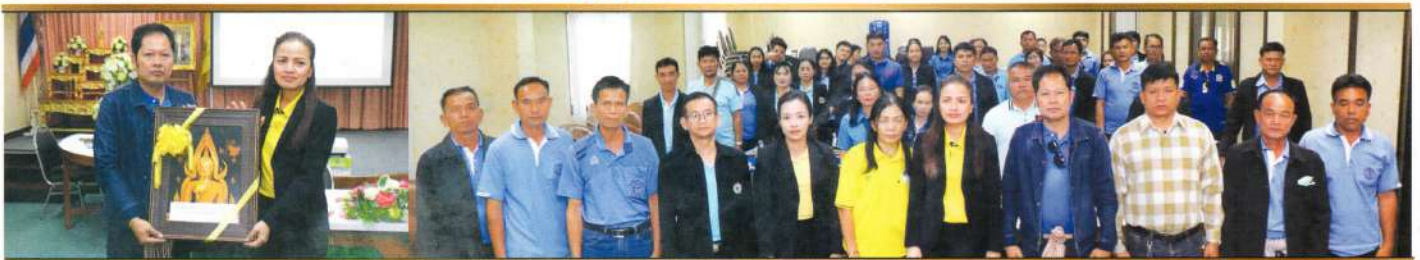
อบต.โนนสวรรค์ จ.อุบลราชธานี