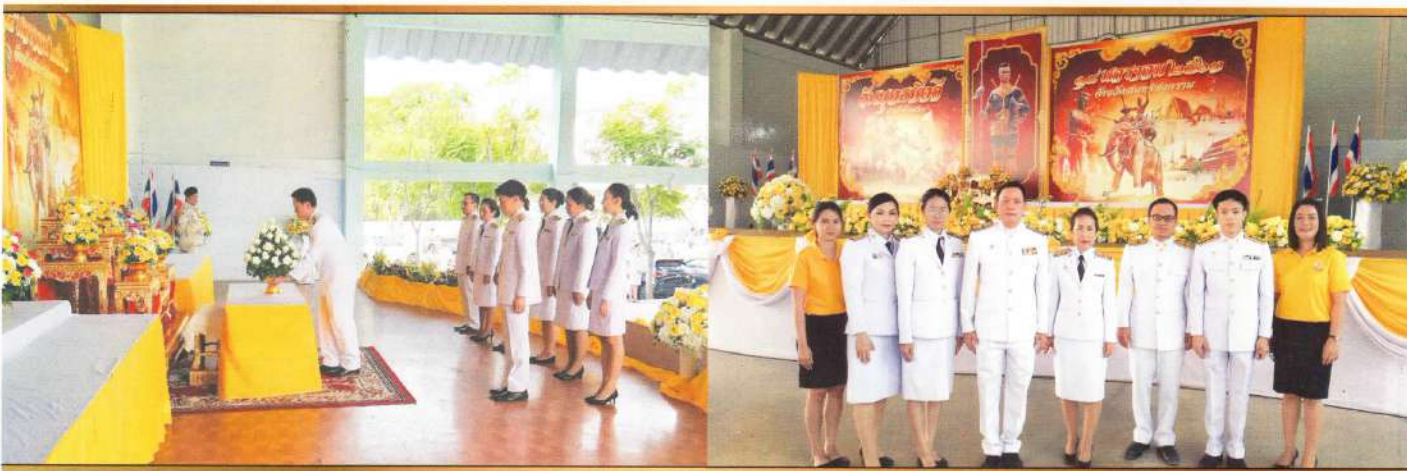
วันยุทธหัตถี