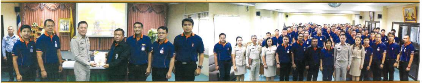
สถาบันพัฒนาบุคลากรท้องถิ่น จ.ปทุมธานี