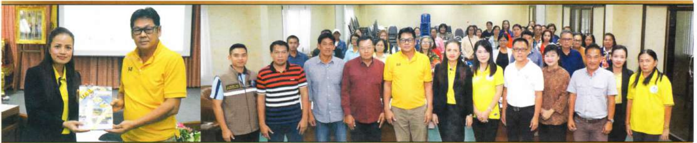
ทต.กุยบุรี จ.ประจวบคีรีขันธ์