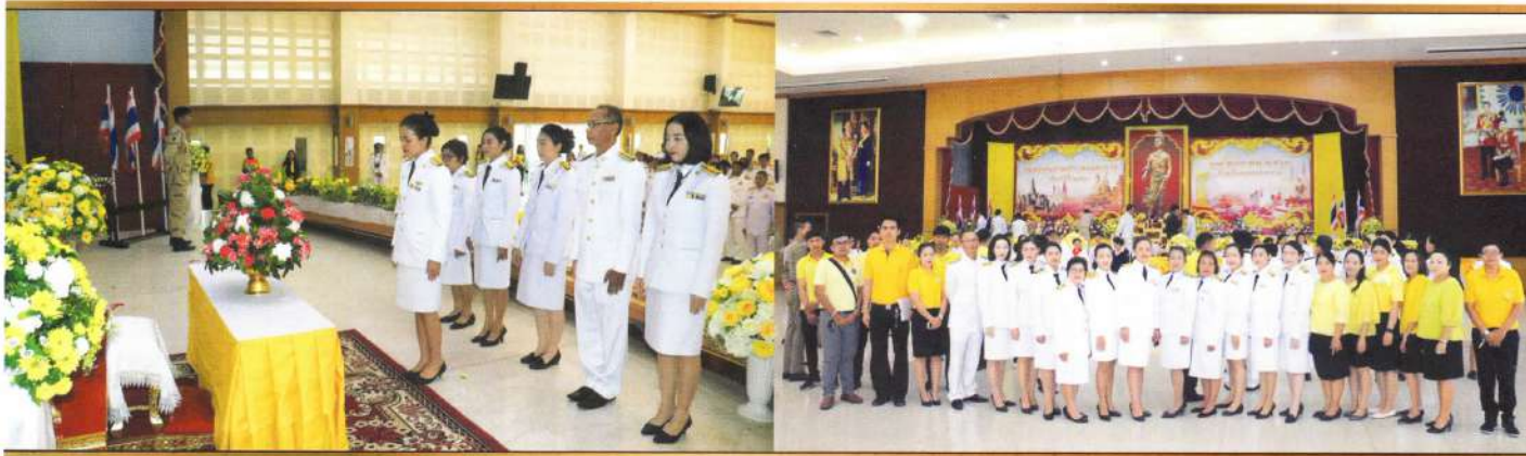
วันพ่อขุนรามคำแหงมหาราช