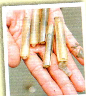
#เมืองหอยหลอด

“เมืองหอยหลอด ยอดลิ้นจี่ มีอุทยาน ร. 2 แม่กลองไหลผ่าน นมัสการหลวงพ่อบ้านแหลม”