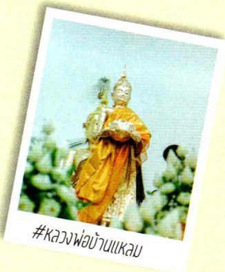
#หลวงพ่อบ้านแหลม

เมืองที่ขึ้นชื่อว่าเล็กที่สุดในเมืองไทย มีพื้นที่รวม 416.7 ตร.กม. ประกอบด้วย 3 อำเภอ ได้แก่ อำเภอเมืองสมุทรสงคราม อำเภออัมพวา และอำเภอบางคนที ซึ่งแต่ละท้องถิ่นต่างก็มีเอกลักษณ์และความงดงามเฉพาะตัว โดยเฉพาะการค้าเดินชีวิตที่โยงโยเป็นหนึ่งเดียวกับแม่น้ำแม่กลอง