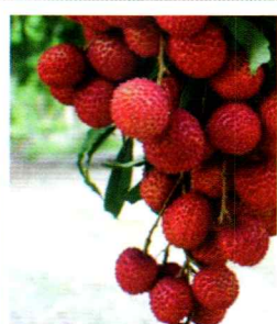
#ยอดลิ้นจี่