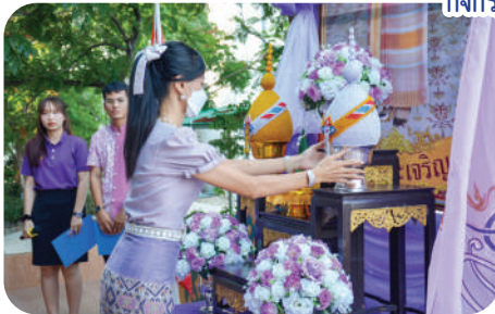
กิจกรรมวันเฉลิมพระชนมพรรษา สมเด็จพระนางเจ้า พระบรมราชินี