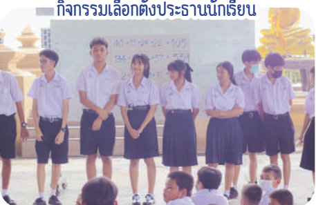
กิจกรรมเลือกตั้งประธานนักเรียน