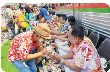
กิจกรรมวันสงกรานต์