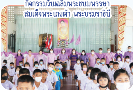
กิจกรรมวันเฉลิมพระชนมพรรษา สมเด็จพระนางเจ้า พระบรมราชินี