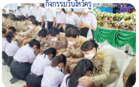
กิจกรรมวันไหว้ครู