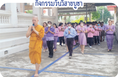
กิจกรรมวันวิสาขบูชา