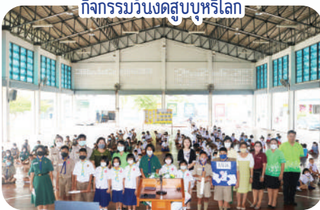
กิจกรรมวันงดสูบบุหรี่โลก