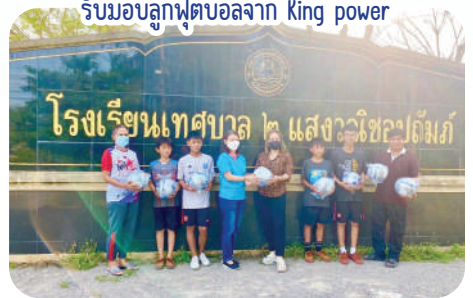
รับมอบลูกฟุตบอลจาก King power