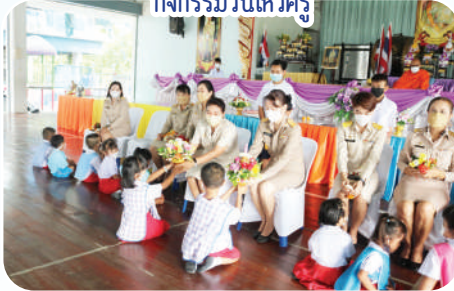
กิจกรรมวันไหว้ครู