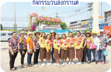
กิจกรรมวันสงกรานต์