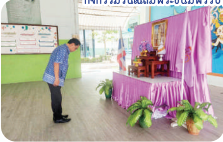
กิจกรรมวันเฉลิมพระชนมพรรษา สมเด็จพระนางเจ้า พระบรมราชินี