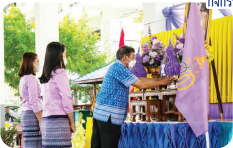
กิจกรรมวันเฉลิมพระชนมพรรษา สมเด็จพระนางเจ้า พระบรมราชินี

โรงเรียนเทศบาลวัดประทุมคณาवास (นิพัทธ์หรือณัฐร์)