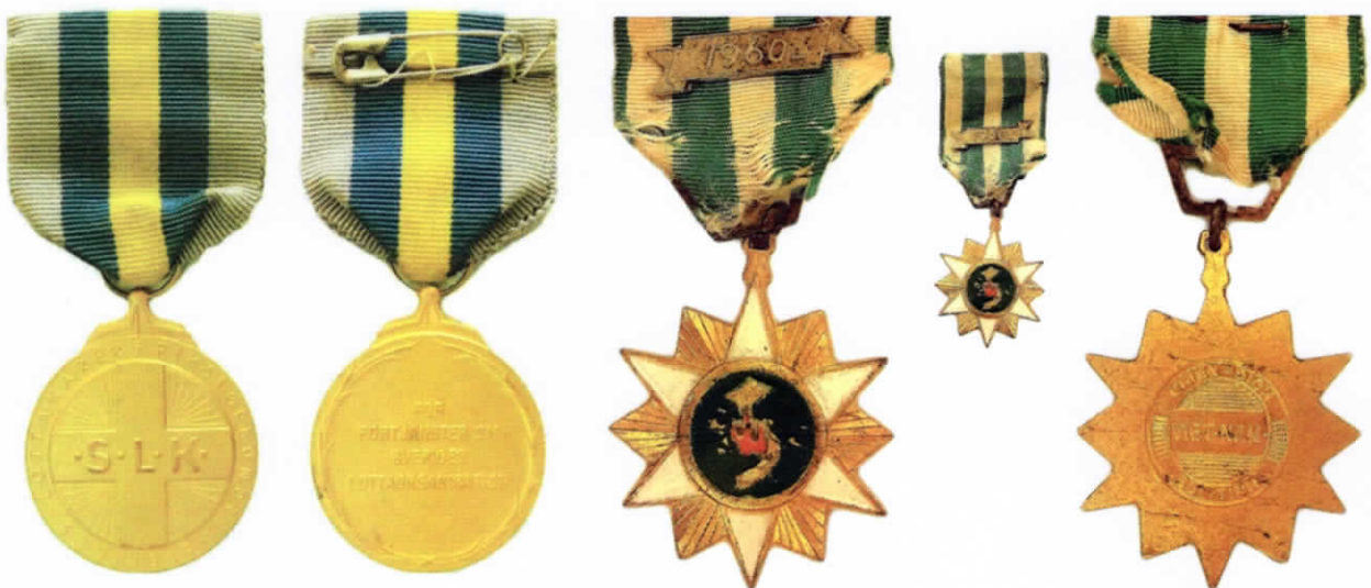
ตัวอย่าง เครื่องราชอิสริยาภรณ์

เครื่องราชอิสริยาภรณ์ในปัจจุบัน เป็นเครื่องหมายใช้ประดับเสื้อ เครื่องแบบพิธีการซึ่งนิยมกันทั่วไป ไม่เว้นแม้แต่ในประเทศที่ไม่มีพระมหากษัตริย์ทรงเป็นประมุข ก็ยังได้รับความนิยม โดยถือว่าเป็นสิ่งส่งเสริมเกียรติของบุคคลผู้มีผลงานดีเด่น ต่อส่วนรวมให้เป็นแบบอย่างที่ดีควรยึดถือ แต่มิใช่เป็นเครื่องหมายแบ่งแยกชนชั้น แต่อย่างใด