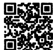
ประกาศฉบับเต็ม